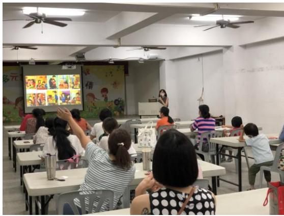
家長提出與教養相關問題