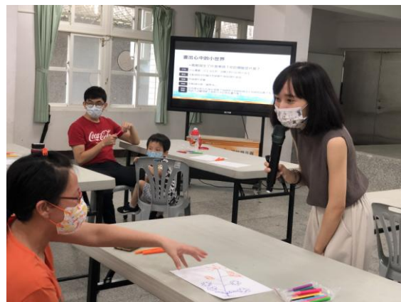
講師回答家長問題