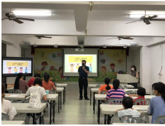
校長致詞歡迎家長蒞校共學