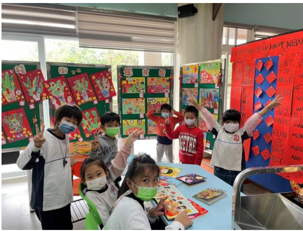
英語閱讀活動「過新年」：低年級學生