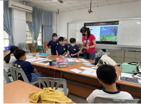
Reader Theater：四年級學生課堂練習