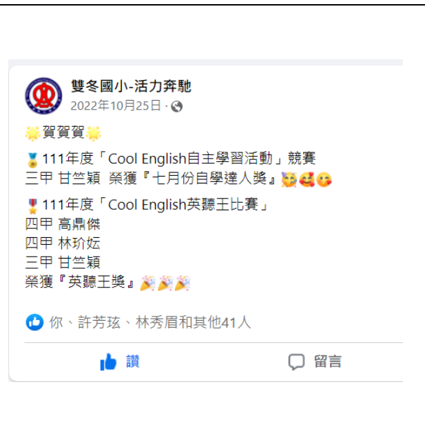
Cool English 111 年度自學達人 英聽王