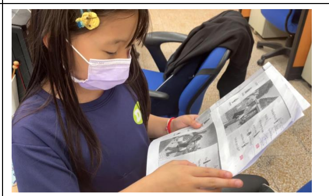
下課 10 分鐘，三至六年級學生找校長、主任、老師檢核英語口說能力。