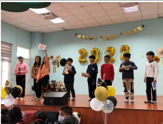
Reader Theater：四年級學生課堂練習