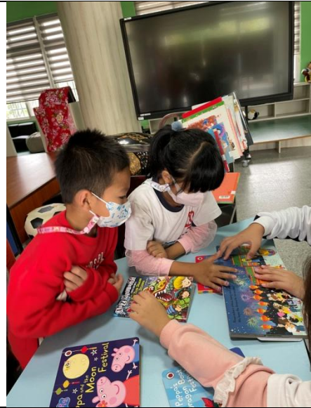
英語閱讀活動「過新年」：低年級學生