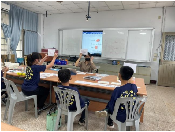
Reader Theater：四年級學生課堂練習