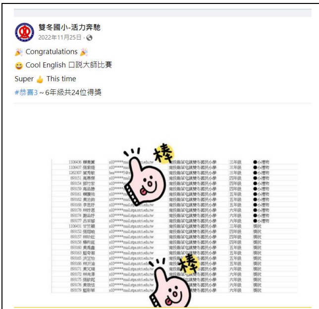
Cool English 111 年度口說大師比賽