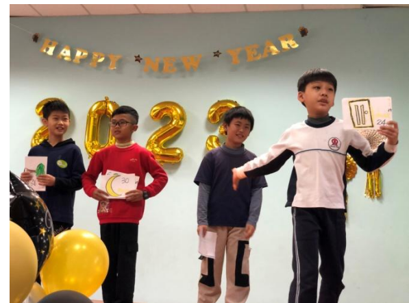
Reader Theater：四年級學生課堂練習